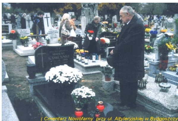
(Cmentarz Nowofarny przy ul. Artyleryjskiej w Bydgoszczy)